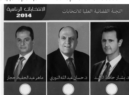
Сирийский избирательный бюллетень

Для участия в голосовании нужно было представить членам избирательных участков карточку, удостоверяющую личность, с которой делается запись в журнал регистрации избирателей. После этого участнику выдается избирательный бюллетень, в котором он в кабине для тайного голосования ставит любую отметку под портретом выбранного кандидата, вкладывает бюллетень в конверт и опускает его в полупрозрачную опечатанную урну для голосования. Затем голосующий окунает указательный палец правой руки в специальную нестирающуюся жидкость синего цвета, которая не смывается в течение 48 часов (данная процедура предусмотрена для предотвращения повторного голосования).